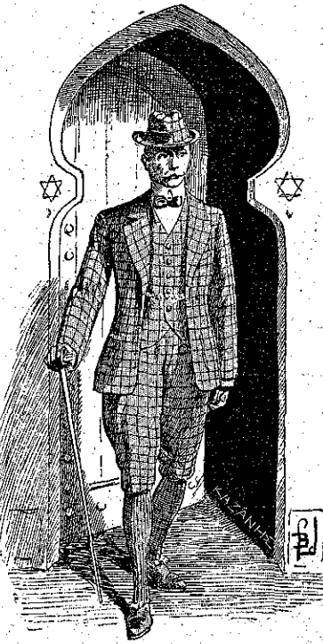
«Η βαρβα θύρα ήνοιχθη...» (Σελ. 222, στ. 6')

Εξόχα! έφώναξε ο Λουλού. Και βέβαια έξόχα! υπέλαβεν ο σπουδαστής, υπέρφανος και με τὸ δίχημα του - διά τὸ κατόρθωμα.