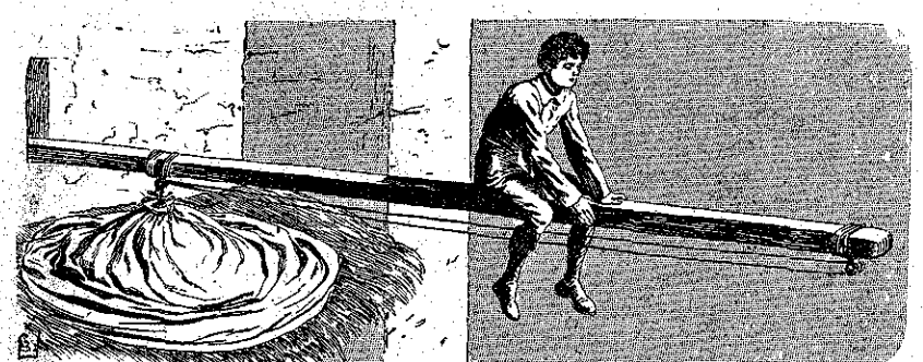
«Είδε τον φίλον του καθήμενον επί της δοκού, υπεράνω της άθύσσου!» (Σελ. 221, στ. 6')

Περίοδος Β'. - Τόμος 21ος Εν Άθήναις, 14 Ίουνίου 1914 Ετος 36ον. - Αριθ. 28